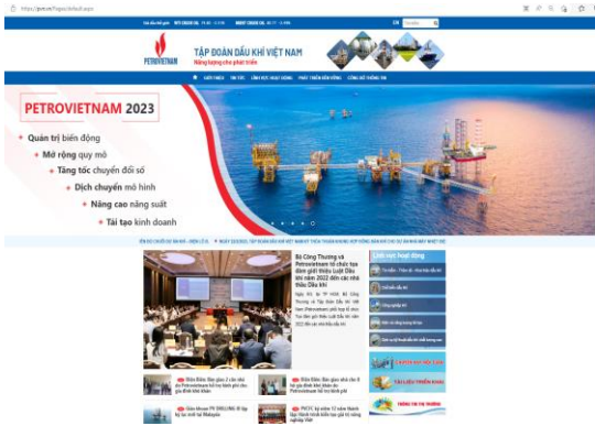
Webiste chính thống của Tập đoàn Dầu khí Việt Nam sử dụng tên miền quốc gia “.vn” (pvn.vn)